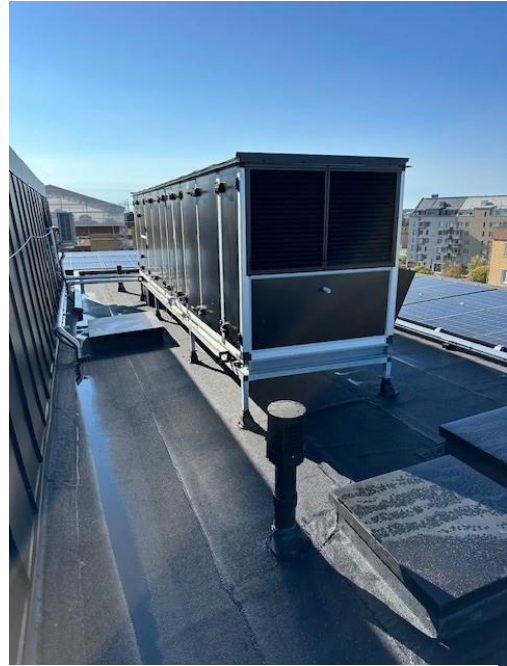
Aggregat och solceller samt detalj för avluftning avlopp.