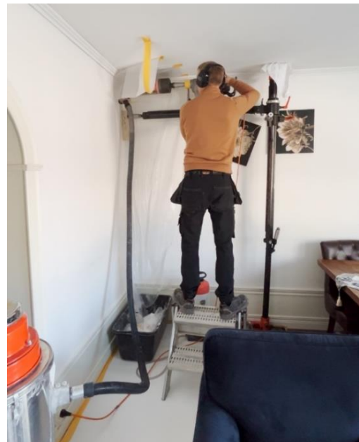
Borring av hål i vägg. Stativ för borrar som bygger hela längden av skyddspappen.