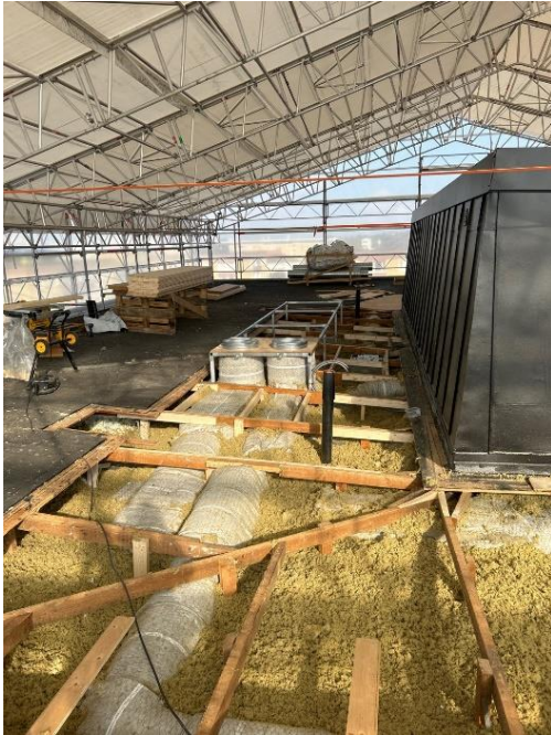
Isolering på rör och lösull på tak - Hus 44.