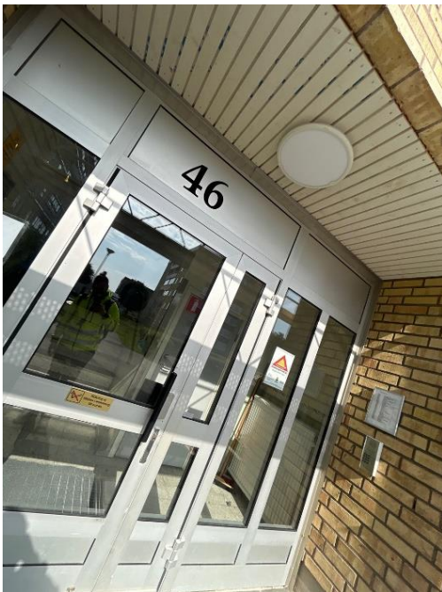
Nya entrélösningar där ventilationen återvinns inne i trapphuset för att spara energi.