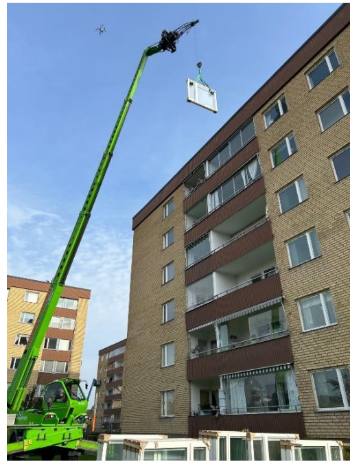
Leverans nr 1 lyftes upp på hus 58.