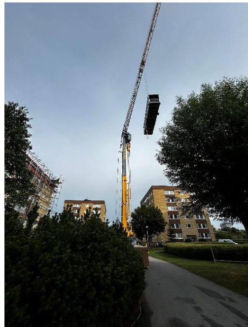
Lyft av ventilationsaggregat till hus 38.